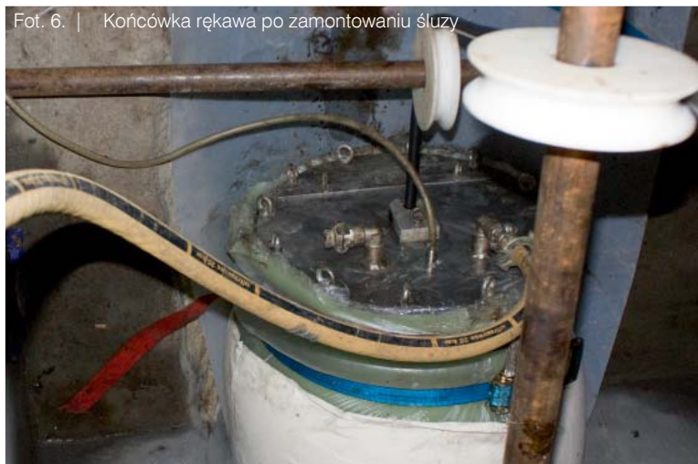
Fot. 6. | Końcówka rękawa po zamontowaniu śluzu

Integralną częścią kontraktu jest renowacja komór i studni znajdujących się na odcinkach poddanych renowacji. Wymagane było uzyskanie odporności betonu na klasę ekspozycji XA3 oraz odcięcie konstrukcji budowli od środowiska agresywnego powłoką modyfikowanej zaprawy mineralnej. W celu właściwego wypełnienia wymagań studnie poddano procesowi hydromonitoringu, usunięto skorodowane stopnie i wykonano reprofilację całości wewnętrznej powierzchni