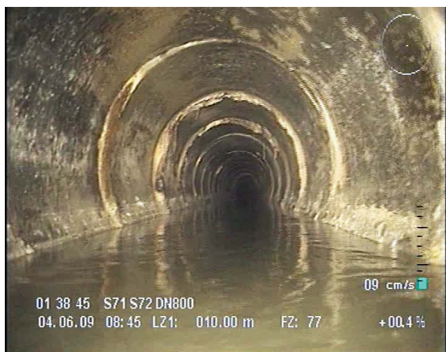
Fot. 2. | Kanał 800 mm, ul. Piłsudskiego

Jak wszyscy zajmujący się bezwypowymi metodami renowacji wiemy, że najtrudniejszą oraz najbardziej czasochłonną częścią naszych zmagani jest przygotowanie kanału do zainstalowania wykładziny. Dokładne usunięcie inkrustacji, ciał obcych oraz zniwelowanie przesunięć segmentów jest szczególnie ważne przy wykonywaniu renowacji wykładziną z włókna szklanego. Wykładzina ta przy swojej stosunkowo niewielkiej grubości