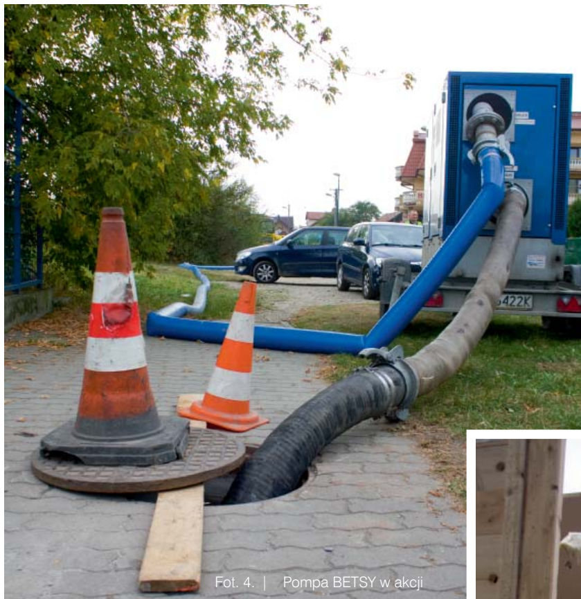
Fot. 4. | Pompa BETSY w akcji

uzyskuje duże wartości sztywności obwodowej, lecz jednocześnie wiernie odwzorowuje wszelkie zakłócenia kształtu kanału. Podczas inspekcji wstępnych odkryliśmy bardzo duże inkrustacje na złączach segmentów rur. Po bliższym przyjrzeniu się problemowi okazało się, iż są to ręcznie nakładane uszczelnienia wykonane zaraz po ułożeniu kolektorów około 35 lat temu. O dziwo, wykonane uszczelnienia częściowo spełniały swoje zadanie, ale dla nas stanowiły nie lada wyzwanie. Praktycznie cała sieć kanalizacji o średnicy 800 mm została uszczelniona tym sposobem. Zakładając, że średnio złącze jest rozmieszczone co 1,2 mb, otrzymujemy 5235 złączy. Przyjmując tylko godzinę przeznaczoną na jedno złącze otrzymujemy aż 218 dób na usunięcie inkrustacji! Testując inkrustacje młotkiem Schmidta otrzymaliśmy wynik klasy betonu około 45-50! Po wielu testach polegających na wykorzystaniu robota frezującego, dysz wysokociśnieniowych