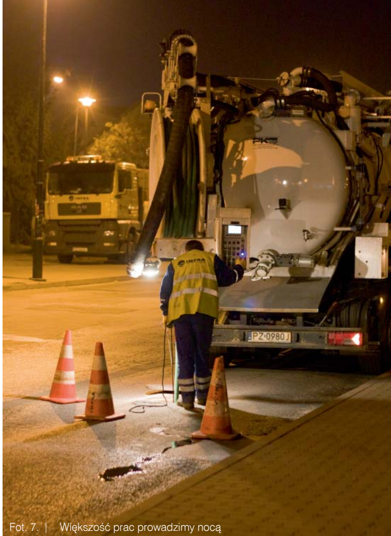
Fot. 7. | Większość prac prowadzimy nocą

W momencie publikacji niniejszego artykułu kontrakt będzie, mamy nadzieję na ukończeniu, a INFRA SA stanie przed nowymi wyzwaniem i będzie realizować kolejne kontrakty w technologii wykładziny utwardzanej promieniami UV. Umiemy to robić, lubimy to robić i robimy to bezpiecznie, bezproblemowo i bezwykopowo. ■