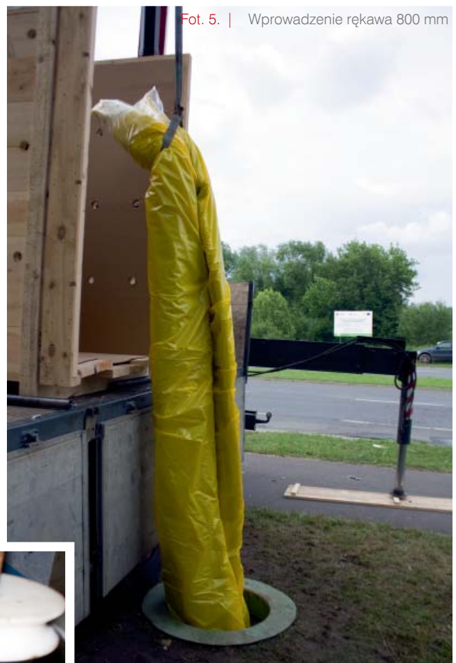
Fot. 5. | Wprowadzenie rękawa 800 mm

Kolejnym wyzwaniem jest bypassowanie kanału w celu odwodnienia odcinków, na których aktualnie trwają prace. O ile objętości ścieków przepływające w okresach bezdeszczowych swobodnie przerzucamy jedną pompą typu „Betsy” (samozasysającą o wirniku stożkowym), to podczas opadów deszczu konieczne jest zastosowanie 3 pomp o wydajności łącznej (maksymalnej) ponad 1500 m 3 /h. Przewody tłoczne nierzadko mają długości przekraczające 200 mb i są prowadzone poza pasem drogowym.