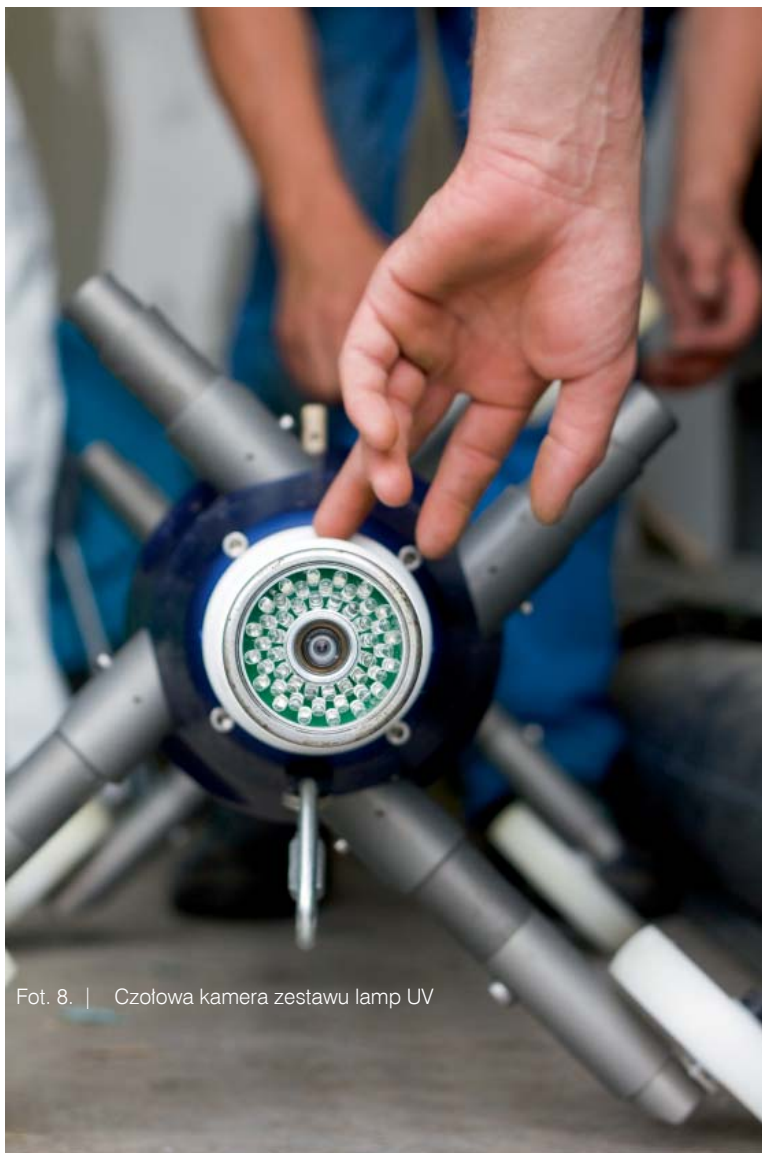
Fot. 8. | Czołowa kamera zestawu lamp UV